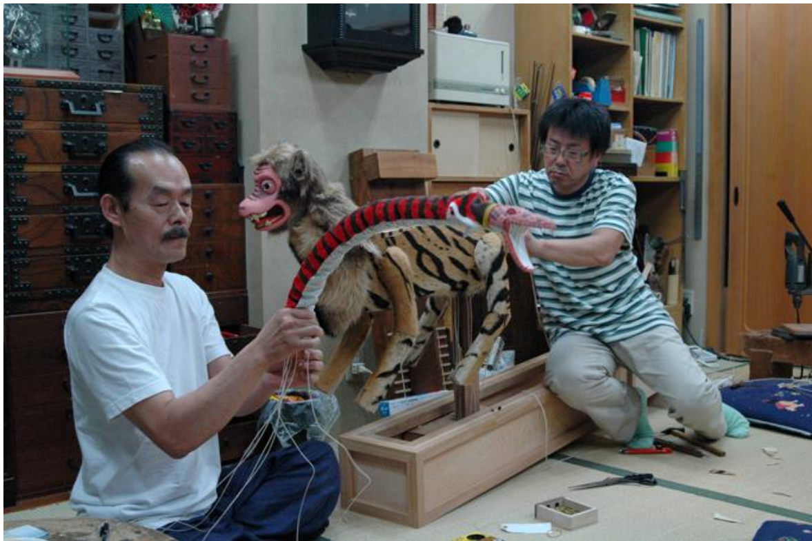
口の開閉、回転、曲がりなど 6本の操り糸 (9月2日撮影)