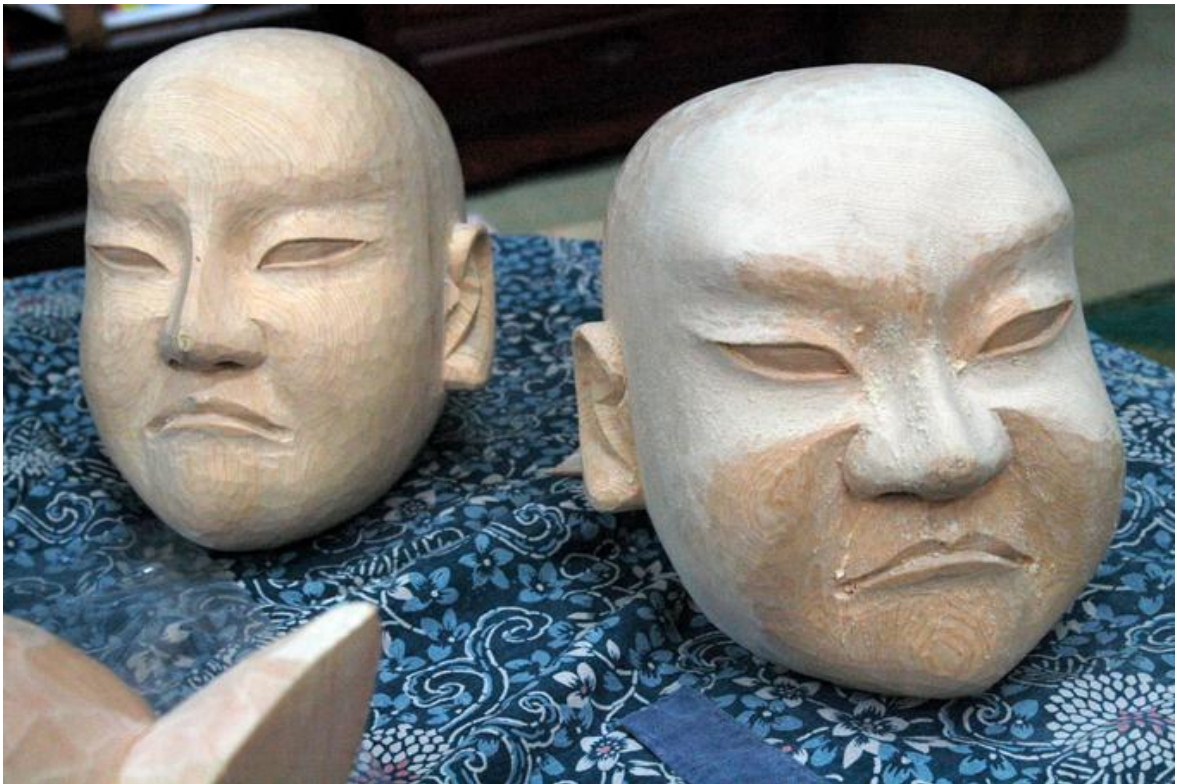
上：7月15日撮影、下：7月28日撮影