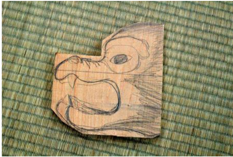
九代目のデザイン