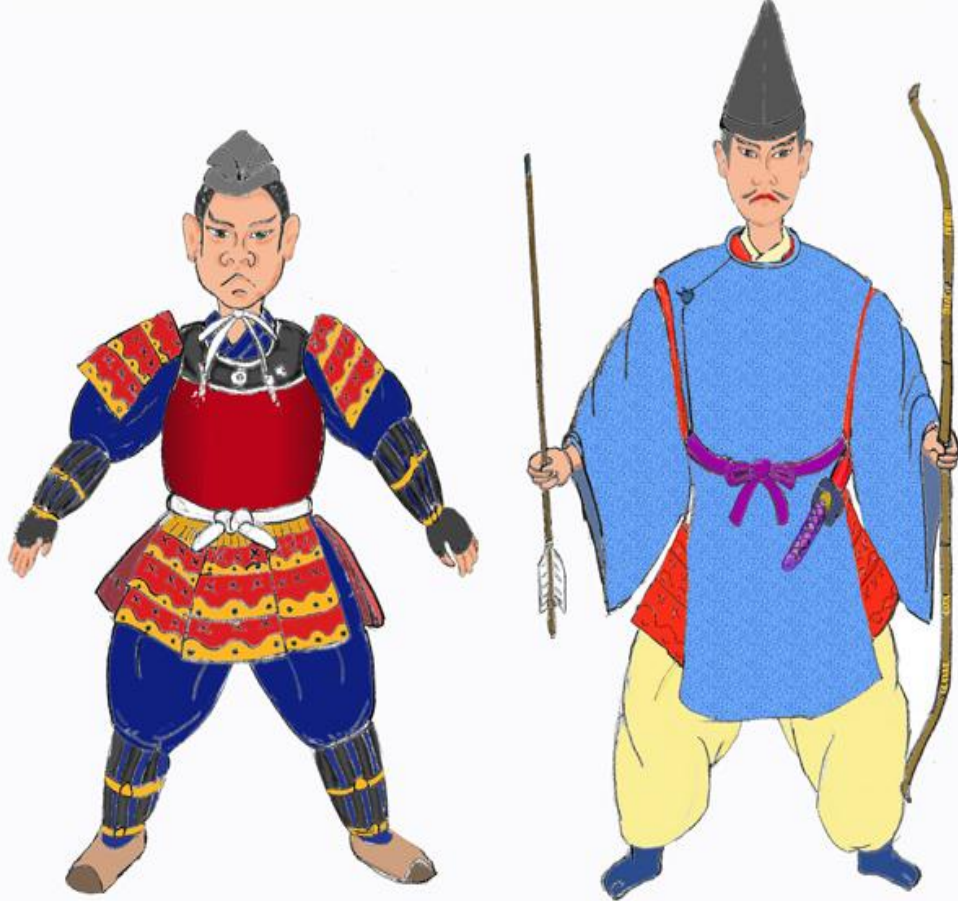
構想2年を経て、九代目が描いたスケッチ